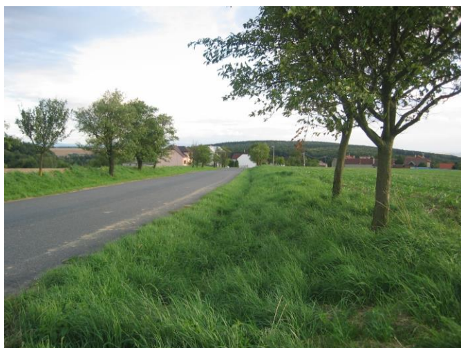
Příjezd do obce – silnice III. třídy

- trasa stávající silnice je stabilizovaná