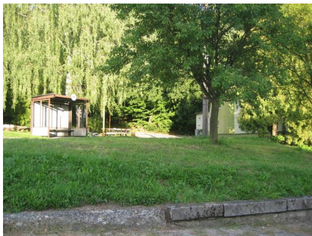
Karlovice – točna

Návrh stabilizuje plochy pro stavby a zařízení hromadné dopravy ve stávajících plochách veřejných prostranství P*. Hromadná doprava je zajišťována pravidelnými autobusovými linkami. Na území obce jsou 2 zastávky: Karlovice, Karlovice – točna. Ze stávajících zastávek linkové autobusové dopravy lze zajistit dostupnost obytného území. Vzhledem k výše uvedenému z hlediska hromadné dopravy nejsou nové nároky na funkční plochy.