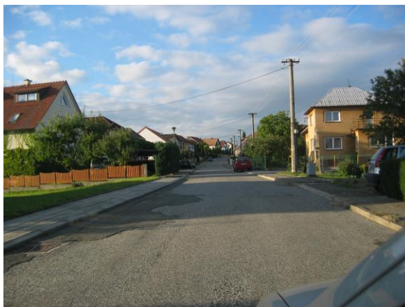
Místní komunikace v jihozápadní části obce

Ochranné pásmo silnic III. třídy , které je 15 m od osy vozovky mimo souvisle zastavěné území, nezasahuje do nově navrhovaných ploch s výjimkou plochy č. 2 (převzata z předchozí ÚPD). Ochranné pásmo není graficky vyznačeno v koordinačním výkrese, protože tato data nebyla předána příslušným poskytovatelem do databáze ÚAP ORP Zlín.