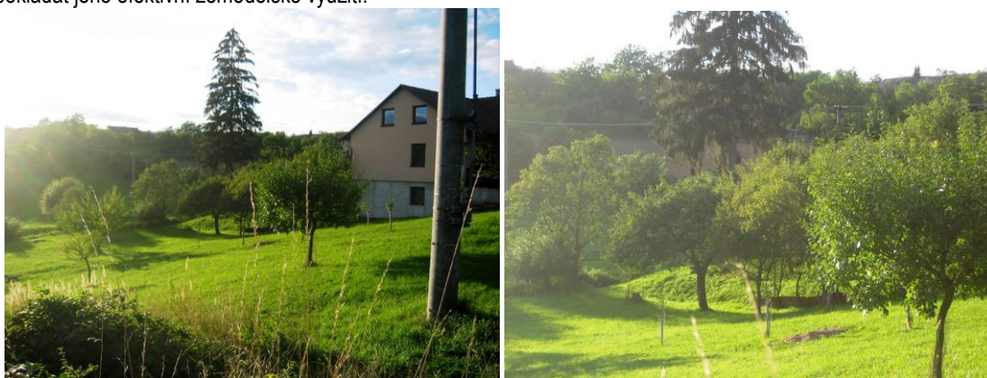
Navrhovaná plocha SO.3 č. 1

Nově navržená plocha č. 1 v jihovýchodní části obce navazuje na stávající plochy se stejnou funkcí. Pro tuto plochu společně s plochami DS č. 7 a P* č. 5 je stanovena podmínka zpracování územní studie, která bude řešit organizaci této plochy . S ohledem na poměrně složité terénní podmínky se předpokládá rozptýlený charakter zástavby s maximálním využitím přírodních podmínek, kdy bude stavba vhodně zakomponována do zeleně - nastaven požadavek na 30% zeleně. To znamená koeficient zastavění max. 70% při rozmezí výměry stavebních pozemků 1500 – 1700 m 2 . Plocha leží v dosahu veřejné, zejména dopravní a technické, infrastruktury. Jedná se o území, které není velkovýrobně obhospodařováno a ani zde nedochází ke ztížení obhospodařování zemědělských pozemků. Řešené území bezprostředně navazuje na zastavěném území, kterým je obklopeno ze tří stran, a tvoří s ním jeden celek. S ohledem na charakter a polohu území nelze předpokládat jeho efektivní zemědělské využití.