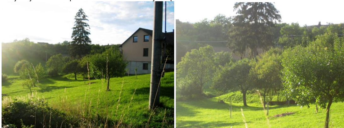
Navrhovaná plocha SO.3 č. 1

- jedná se o nově navrženou plochu v jihovýchodní části obce, která navazuje na stávající plochy se stejnou funkcí. Pro tuto plochu společně s plochami DS č. 7 a P* č. 5 je stanovena podmínka zpracování územní studie, která bude řešit organizaci této plochy. S ohledem na poměrně složitě terénní podmínky se předpokládá rozptýlený charakter zástavby s maximálním využitím přírodních podmínek, kdy bude stavba vhodně zakomponována do zeleně - nastaven požadavek na 30% zeleně. To znamená koeficient zastavění max. 70% při rozmezí výměry stavebních pozemků 1500 – 1700 m 2 . Plocha leží v dosahu veřejné, zejména dopravní a technické, infrastruktury. S ohledem na lokalizaci pohledového horizontu není potřeba pro tyto plochy nastavovat podmínky ochrany krajinného rázu ve vztahu k dálkovým pohledům. Je nastavena výšková hladina jedno nadzemní podlaží a podkroví, což odpovídá i charakteru okolní zástavby. Využití plochy je podmíněno zpracováním územní studie společně s plochami DS č. 7 a P* č. 5. Výše uvedené požadavky na plošnou a prostorovou regulaci a podíl zeleně a rozmezí výměry stavebních pozemků budou zohledněny ve zpracováváné územní studii.