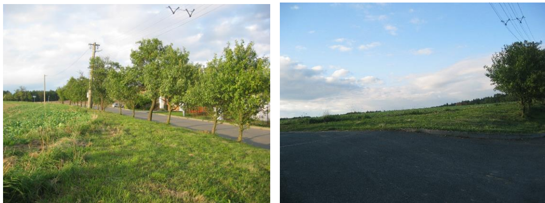
Navrhovaná plocha SO.3 č. 2

- jedná se o plochu, která byla převzata z původní ÚPD a leží v severozápadní části území u silnice III. třídy. Zástavba se předpokládá podél komunikace v pásu o šířce max. 30 m od plochy veřejných prostranství, označených P*, čemuž odpovídá i nastavená regulace této plochy. Smyslem regulace je zachovat část pozemku pro zahrady, které budou tvořit přechodovou zónu do volné krajiny. Využití plochy je podmíněno zachováním prostupnosti do krajiny (zachování polní cesty podél jižní hranice). Pro plochu je stanovena max. výšková hladina zástavby 1 nadzemní podlaží a podkroví, tak aby nebyla narušena silueta sídla. Jedná se současně o plochu ležící na pohledovém horizontu, kde je nutno umístit zástavbu, která nebude narušovat obraz místa a siluetu obce svým cizorodým vzhledem a nepřirozenou barevností a nebude vytvářet negativní pohledové dominanty. Výše uvedeným požadavkům odpovídá i nastavená regulace plochy.