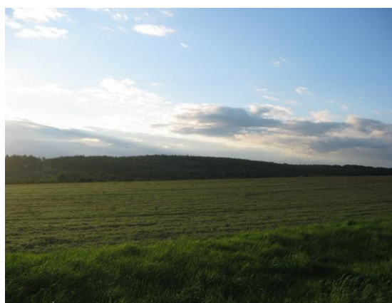
Pohled na území obce od východu – rozsáhlé lesní porosty

Regionální ÚSES nezasahuje do řešeného území.