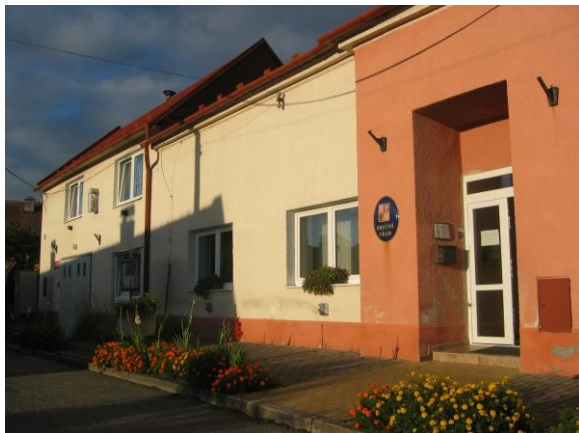
Obecní úřad a hasičská zbrojnice

Územní plán stabilizuje stávající plochy občanského vybavení charakteru veřejné vybavenosti se stavbami obecního úřadu, hasičské zbrojnice, pohostinství, domu kultury, stávajícího sportovního areálu fotbalového hřiště, kaple apod. ve stávajících monofunkčních plochách občanského vybavení (O). Navržené využití odpovídá podmínkám využití těchto ploch. Občanské vybavení je také přípustné v dalších funkčních plochách – SO.3.