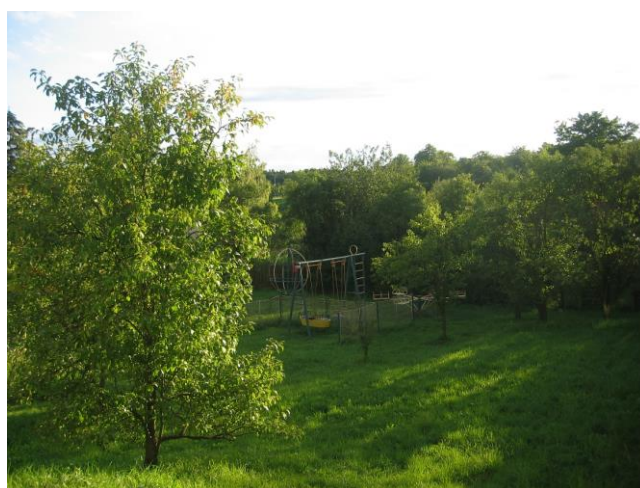
Navrhovaná plocha P* č. 5 – přístup k ploše č. 1 ze severovýchodní strany