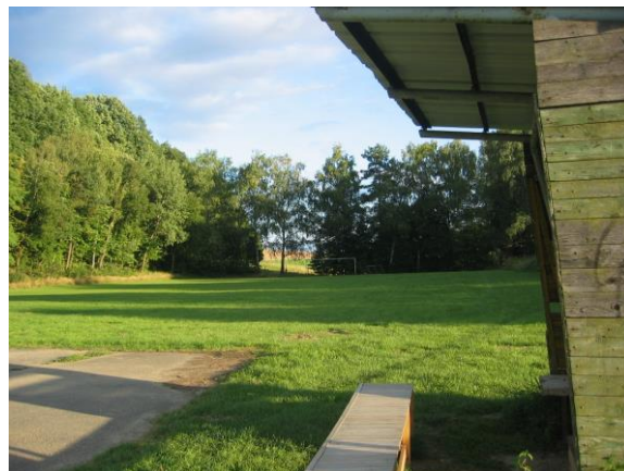
Sportovní areál – fotbalové hřiště