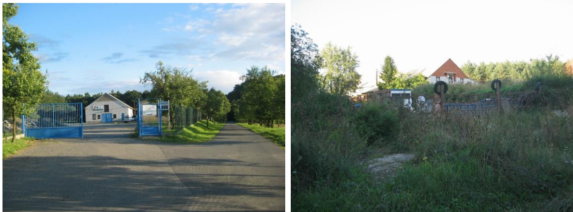
Stávající výrobní areál a jeho navrhované rozšíření – plocha V č. 4

Pro plochu je navržena prostorová regulace – maximální výška vztažená k úrovni upraveného terénu – 9 m, což odpovídá požadavkům na maximální výškovou hladinu staveb drobné výroby. Současně je v rámci uvedené plochy uplatněn požadavek na zajištění zeleně v rozsahu min. 15 % za účelem minimalizace negativních vlivů výrobních provozů na okolí, zejména ve vztahu ke krajinnému rázu.