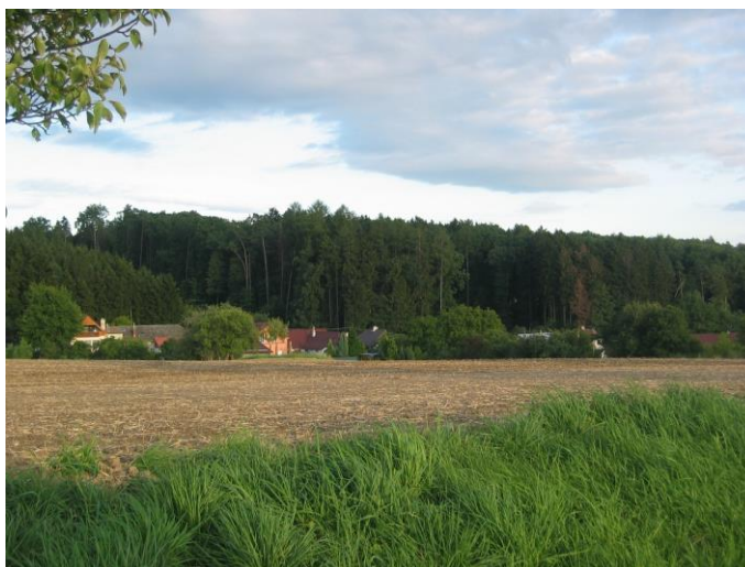
Pohled na obec od severu – ráz krajiny

zemědělská harmonická. Typická je převaha zemědělských kultur. Z hlediska reliéfu krajiny se jedná převážně o pahorkatiny s menšími vesnickými sídly atraktivními pro bydlení. Mezi výrazné znaky území patří dochované urbanistické a architektonické znaky sídel, extenzivní trvalé zemědělské kultury - louky, pastviny apod. a drobné sakrální stavby v krajině. Vzhledem k charakteru krajiny byl minimalizován návrh zastavitelných ploch ve volné krajině (zejména není rozvíjena nová zástavba podél linie horizontu). Za účelem zachování typického rázu sídel byla stanovena maximální výšková hladina a další typy regulace ve vztahu k pohledovému horizontu procházejícímu obcí. – viz kap. F. Návrhu. Nejsou navrhovány plochy pro rodinnou ani hromadnou rekreaci, ani nejsou nově vymezovány plochy pro zavádění intenzivních forem rekreace a cestovního ruchu. Nově navrhované zastavitelné plochy jsou ve většině případů v přímé návaznosti na zastavěné území. Je doplněn systém krajinné zeleně s funkcí ekostabilizační (ÚSES). Jedním z cílů je zachovat harmonický vztah sídla a zemědělské krajiny, zejména zachovat podíl zahrad, což je zaručeno navrženou regulací.