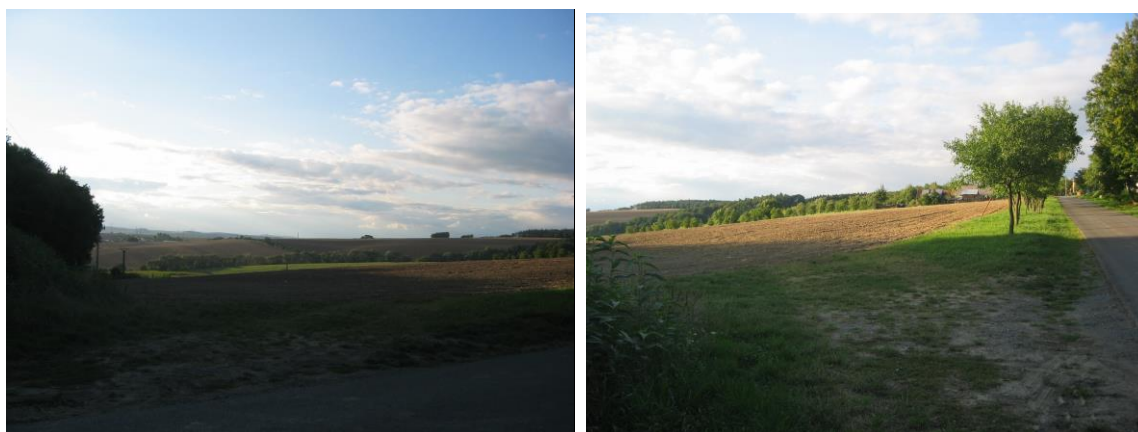
Navrhovaná plocha SO.3 č. 3

- navržená plocha v jihozápadní části obce (převzata z předchozí ÚPD – změna č. 2 ÚPO Karlovice), která je limitována elektrickým vedením VN vedeným jižně od navrhované plochy a pásmem do 50 m od lesa v jižní části. Zástavba se předpokládá podél komunikace v pásu o šířce 10 – 40 m od plochy veřejných prostranství, označených P*, čemuž odpovídá i nastavená regulace této plochy. Smyslem regulace je zachovat část pozemku pro zahrady, které budou tvořit přechodovou zónu do volné krajiny a současně odsunout zástavbu od stávající komunikace a od stávajících ploch výroby. Pro plochu je stanovena max. výšková hladina zástavby 1 nadzemní podlaží a podkroví, tak aby nebyla narušena silueta sídla. Jedná se současně o plochu ležící na pohledovém horizontu, kde je nutno umístit zástavbu, která nebude narušovat obraz místa a siluetu obce svým cizorodým vzhledem a nepřirozenou barevností a nebude vytvářet negativní pohledové dominanty. Výše uvedeným požadavkům odpovídá i nastavená regulace plochy. Jak pro plochy smíšené obytné vesnické, tak pro plochy výroby a skladování je nastaven požadavek na využití, stavby a opatření bez negativního vlivu na okolní zástavbu.