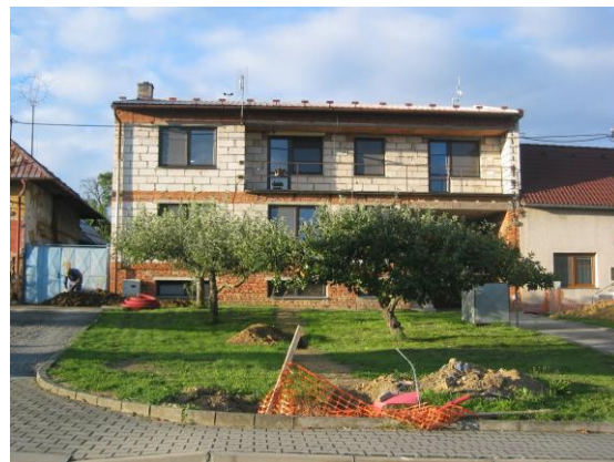
Centrální prostor obce – stávající řadová zástavba a ukázka zástavby nerespektující okolní měřítka