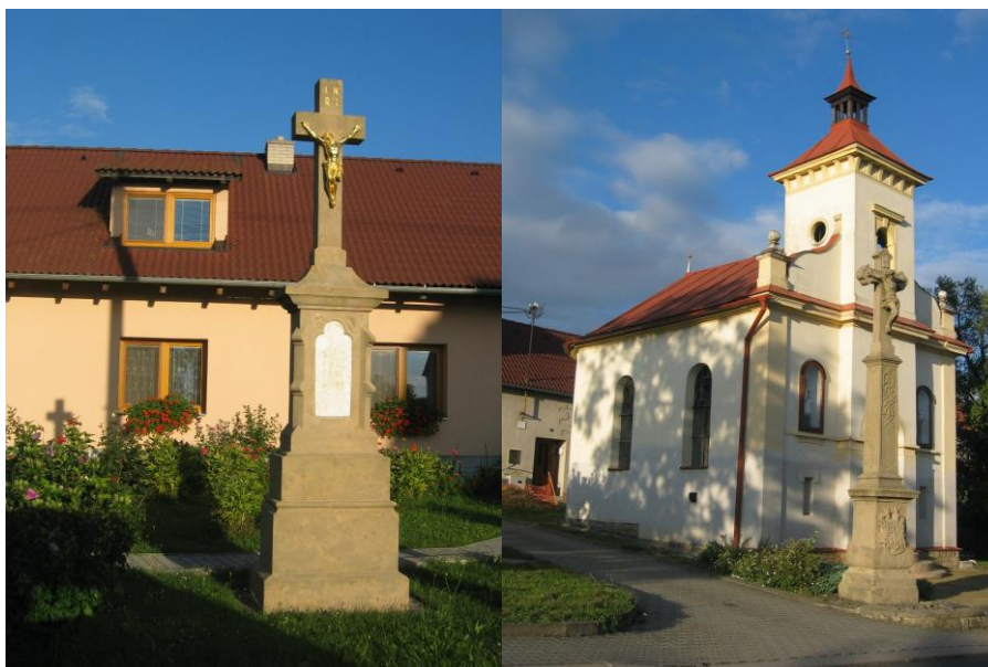
Kříž v jihozápadní části obce a kaple s křížem v centrální části obce

Celé území obce lze považovat za území s archeologickými nálezy a podmínky pro daný případ upravuje v rámci realizace staveb příslušná legislativa. To znamená, že v případě stavebních činností na území s archeologickými nálezy jsou stavebníci již od doby přípravy stavby povinni tento záměr oznámit Archeologickému ústavu Akademie věd České republiky a umožnit jemu nebo oprávněné organizaci provést na dotčeném území záchranný archeologický výzkum.