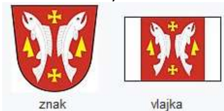
Obrázek 3 - Znak a vlajka obce Karlovice