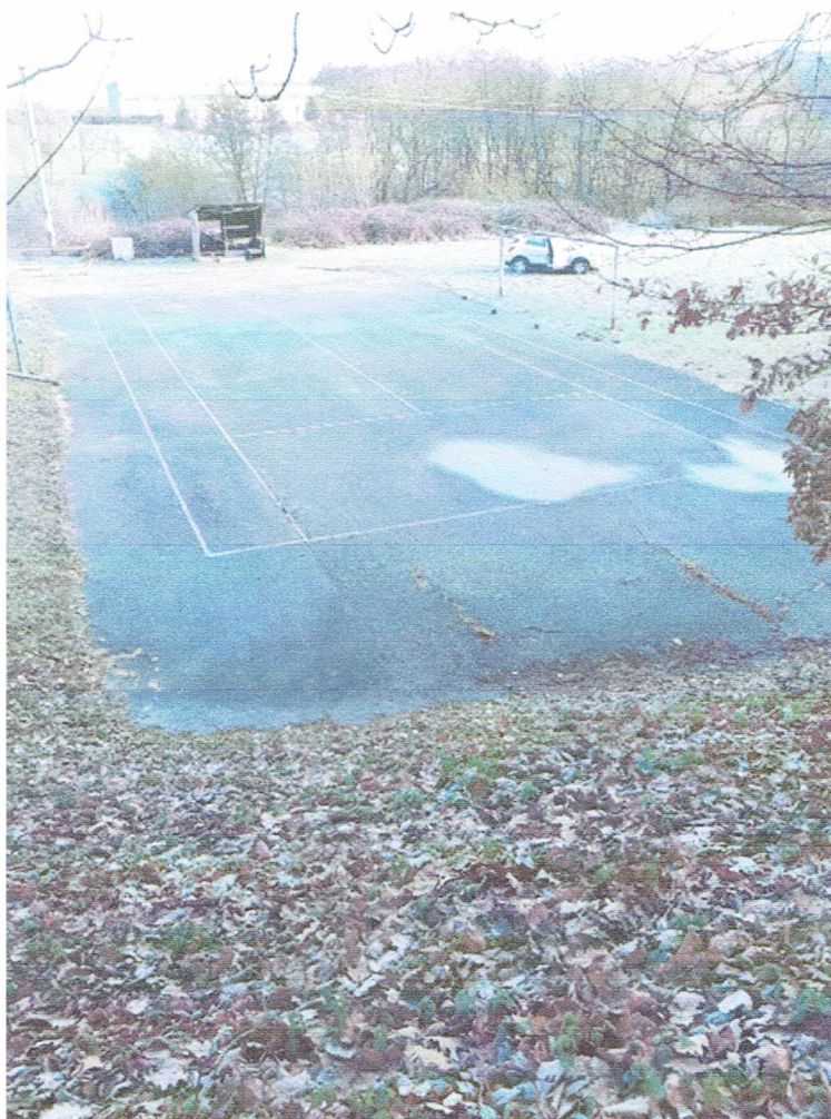
Obrázek 1: Aktuální stav místa plnění (p. č. 299/5 a 299/6)

Místem plnění veřejné zakázky jsou pozemky p.č. 299/5 a 299/6, k.ú. Karlovice u Zlína.